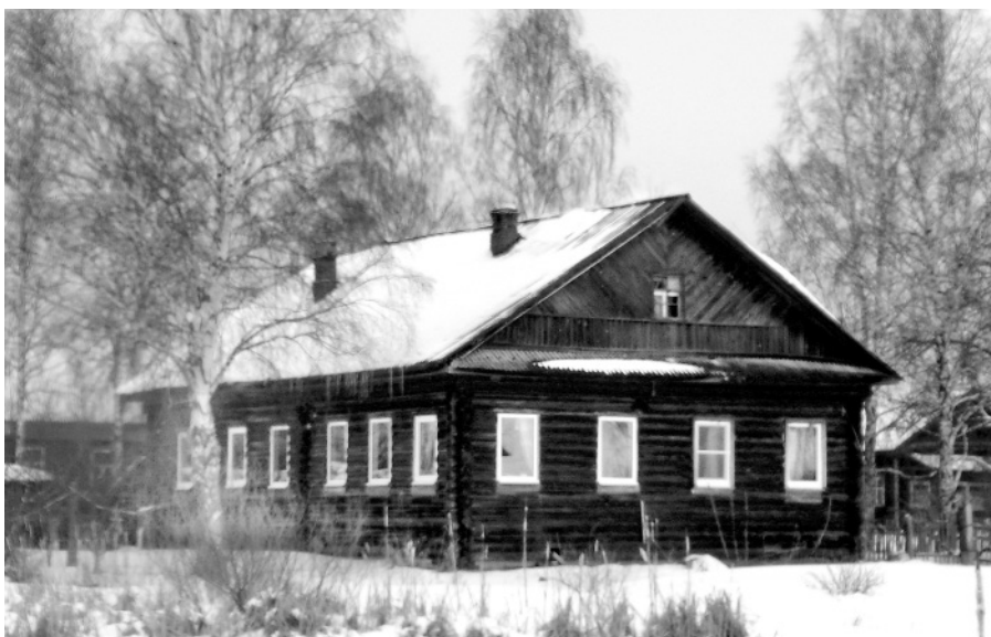
По преданию, в опустевшей ныне избе Сорокоумовых до революции располагалось волостное правление, одну из комнат которого и занимала Рождественская библиотека.