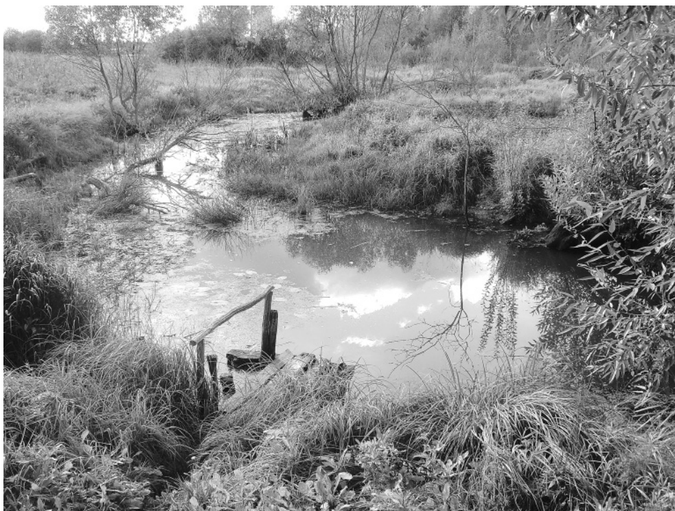
Река Нерга при деревне Кривцово.

Рассмотрим в первую очередь древнее название этой реки – Нелгера, которое в XVII – XVIII столетиях вышло