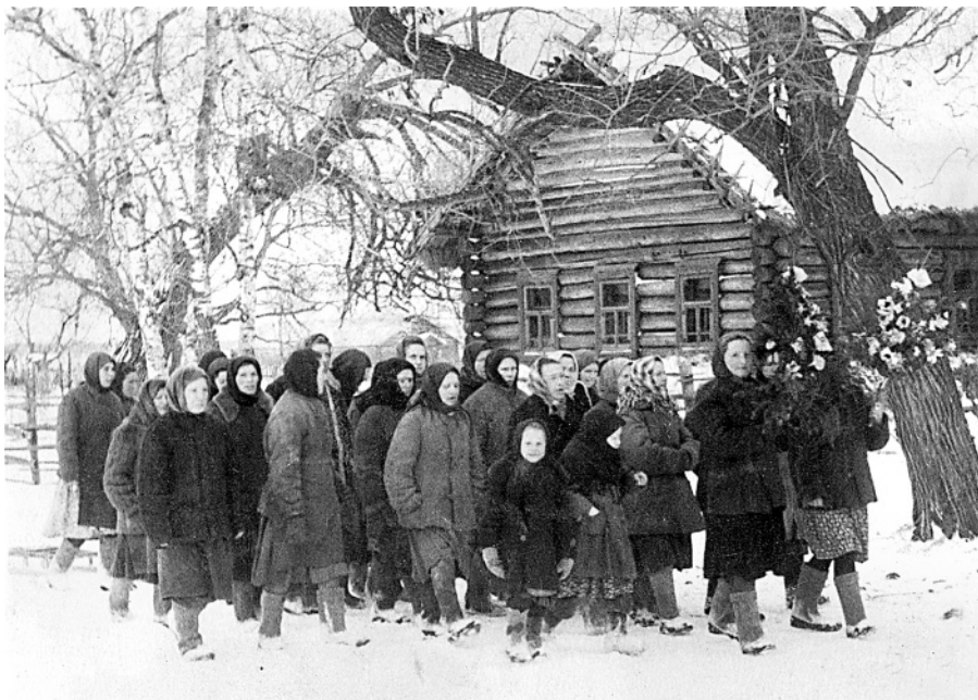
Дьяконовка. Хождение «с красам». Ноябрь 1956 года.

Снимок из собрания Этнографического музея кацкарей