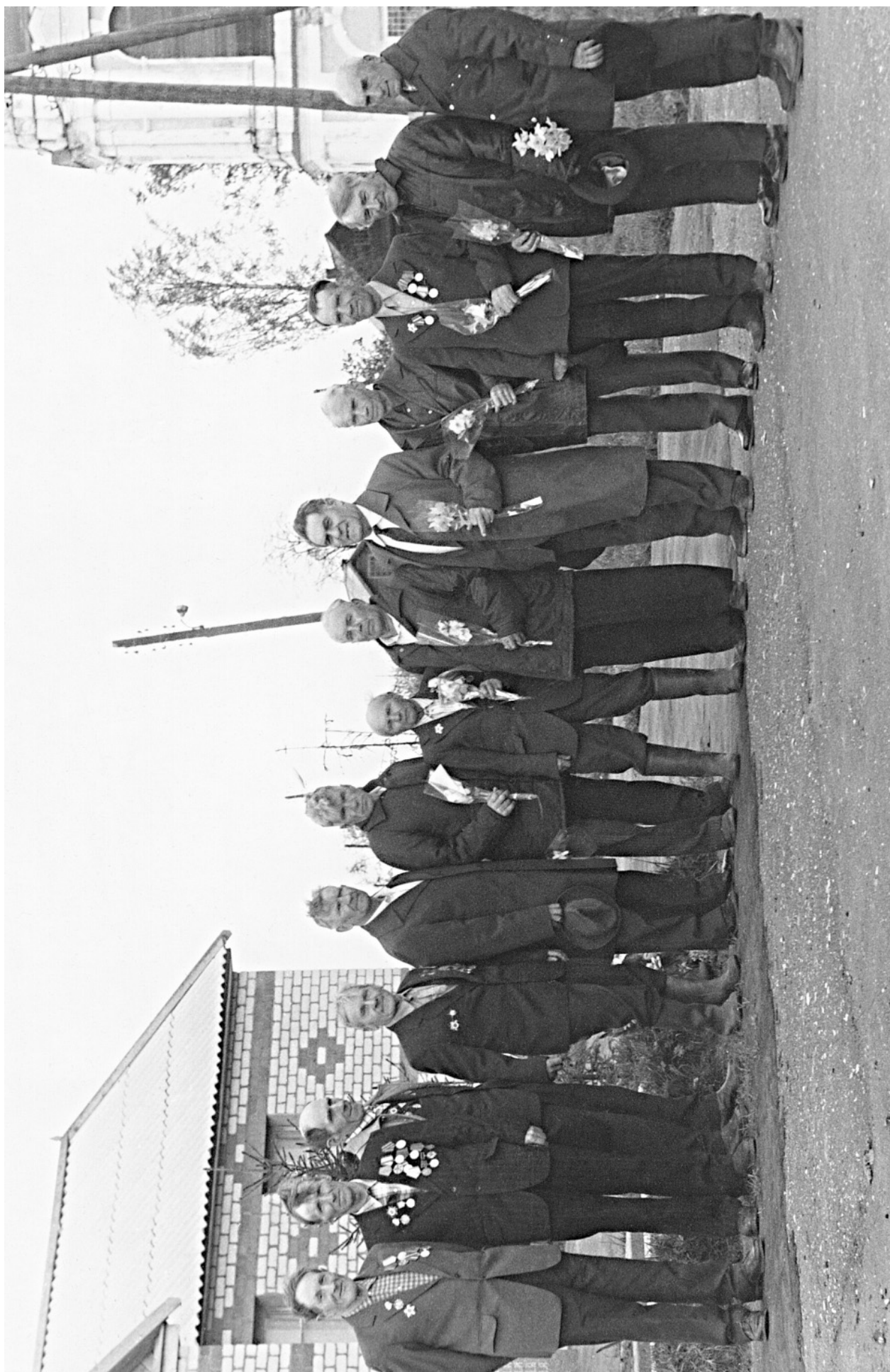
ОРДИНО. ВЕТЕРАНЫ. 9 мая 1945 года. с. Ордино.