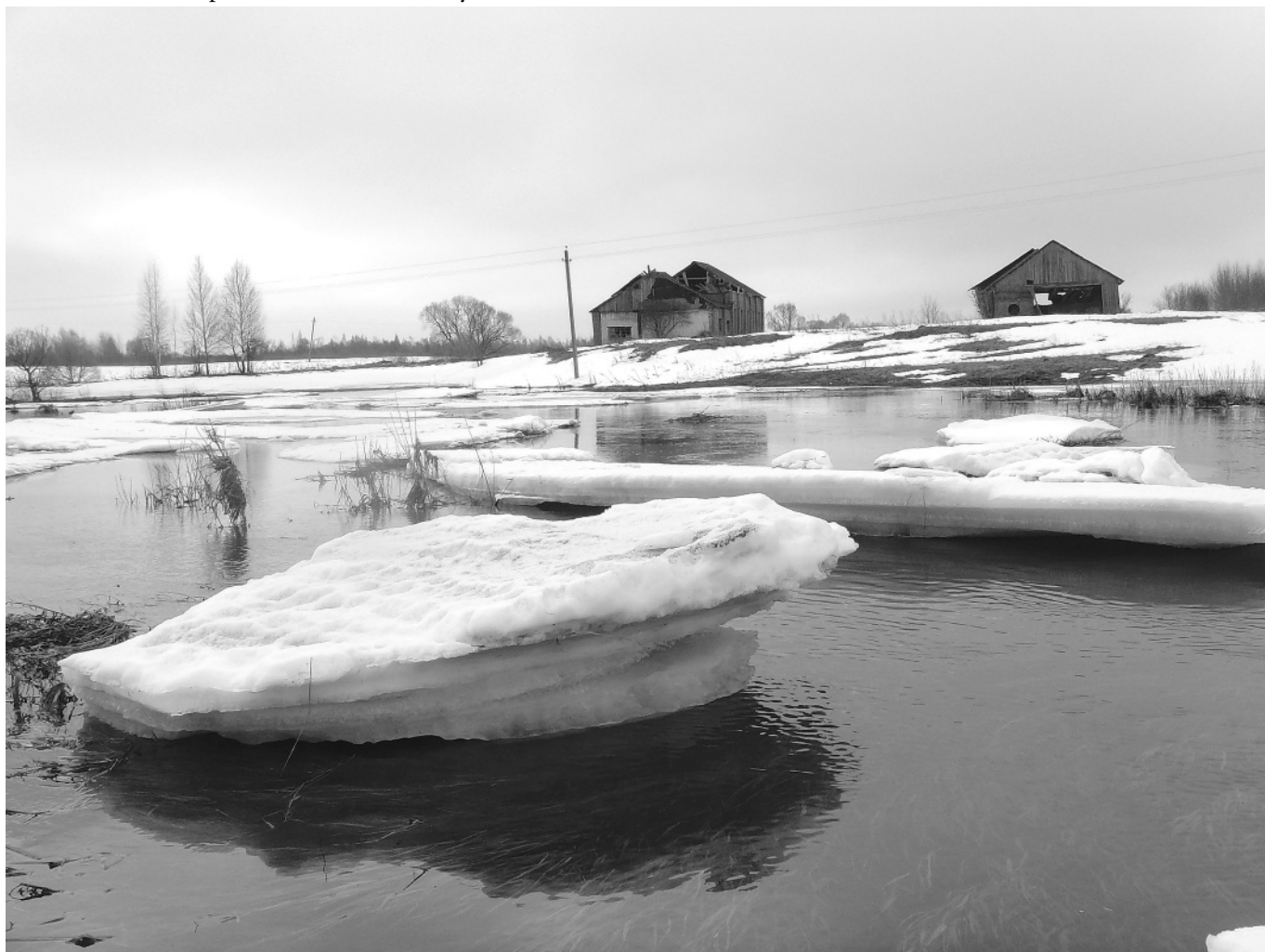
Река Пойга. Водополица у деревни Исакова

Мызников, 2004 – Мызников С.А. Лексика финно-угорского происхождения в русских говорах Северо-Запада: Этимологический и лингвогеографический ана-