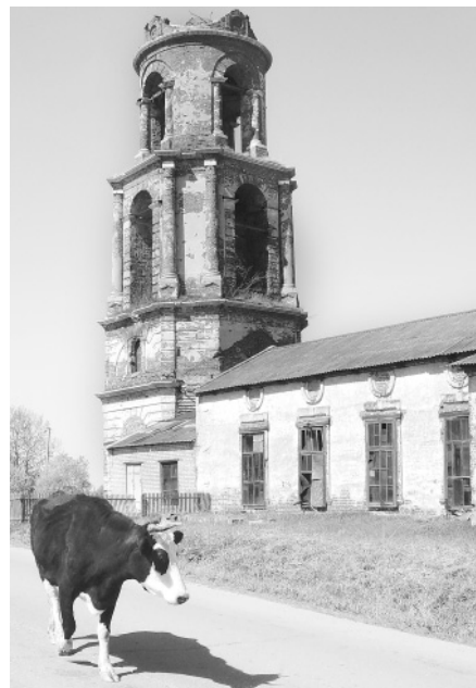
Колокольня церкви села Рождествено в Кадке 160 лет!