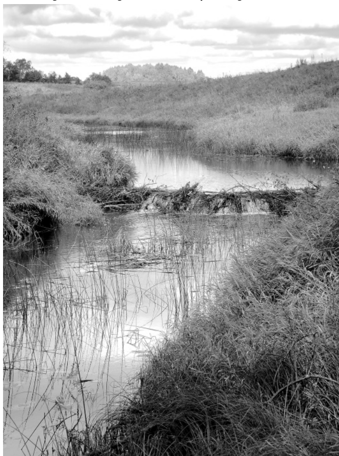
Река Кадка. Бобровая плотина у Пальцева близ села Ордина. 2007 год

Что же представлял собой этот местный путь в исторические времена? В дорусскую эпоху это мог быть внутренний торговый путь между племенными группировками меря и весь, граница между которыми, по оценке