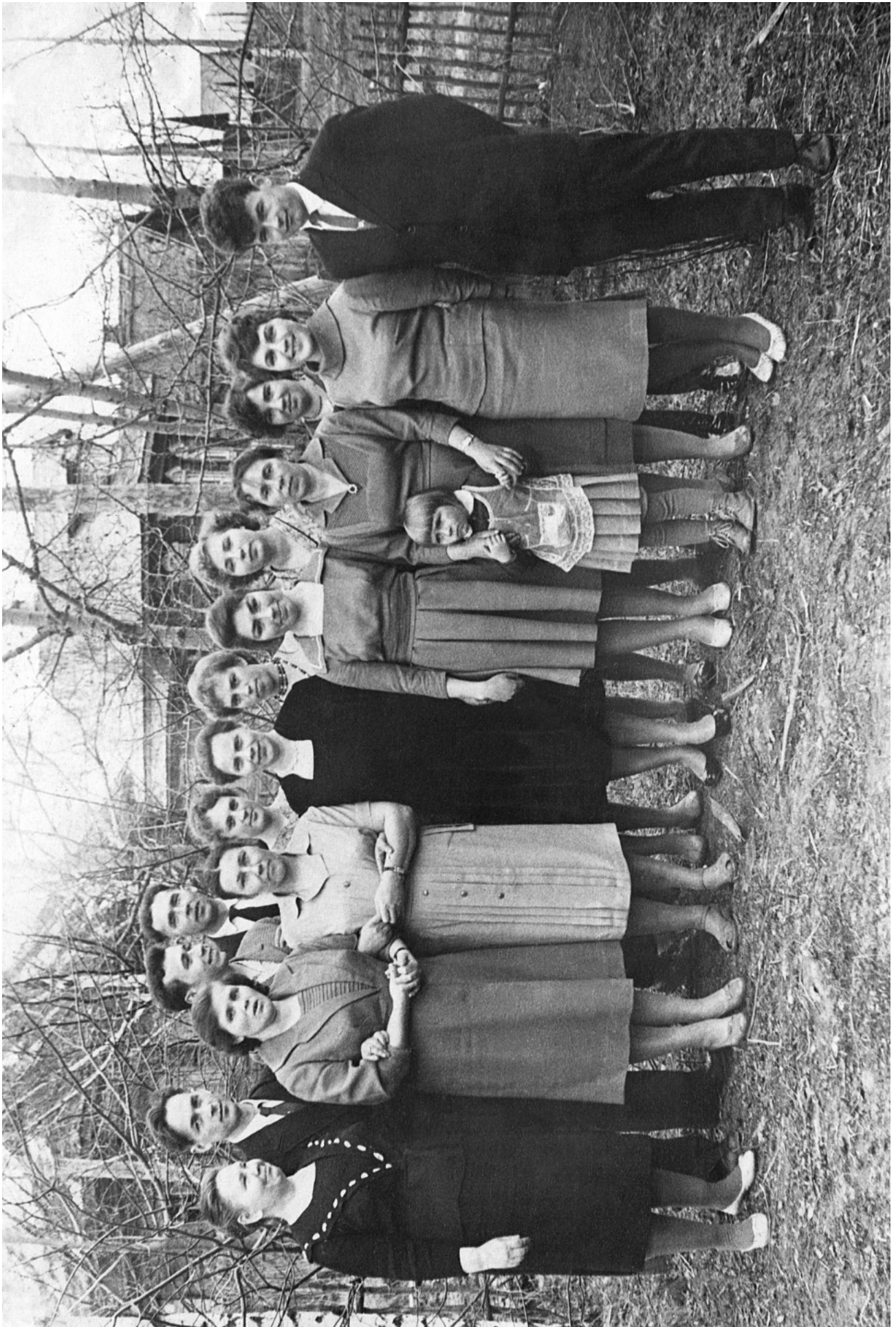
РОЖДЕСТВЕНО. МАЙ. 1964-1965 годы.