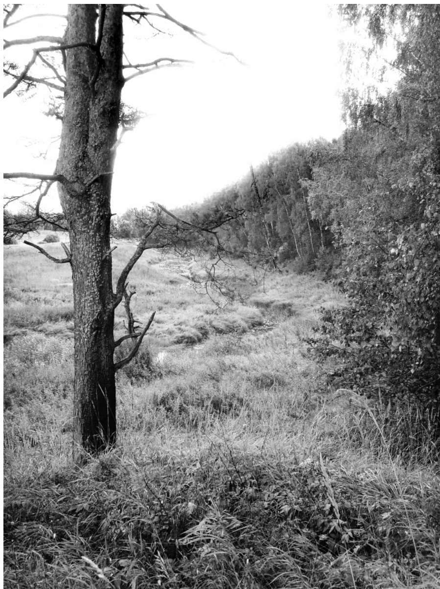
Лес по правому берегу реки Кадки и есть Пальцево, бывшее когда-то и деревней, и сельцом.

8. «Ведомости о составе крестьянских и частновладельческих земельных владений по Хоробровской волости. 1907 год» // УгФ ГАЯО, фонд 82, опись 1, единица хранения 114.