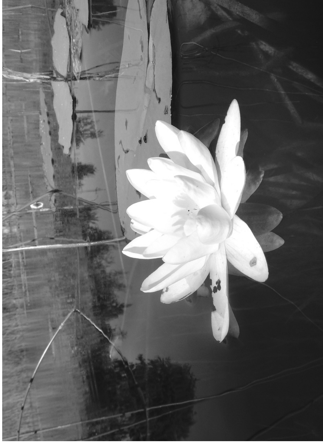
Кадка. Лето. Косой омут у Широбокова.