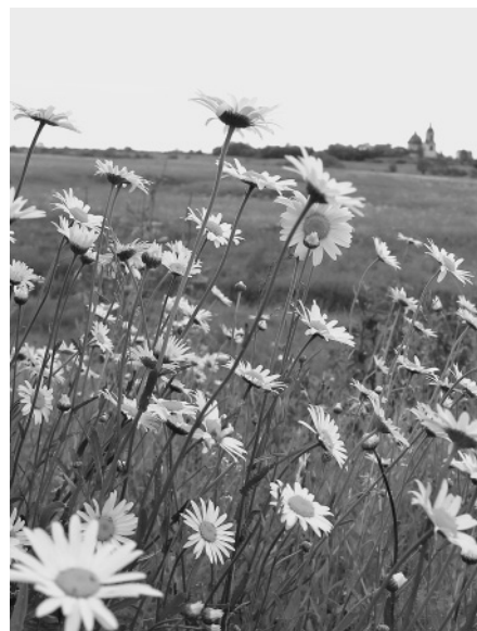
На Родине Марии Васильевны расцвели ромашки...

Сергей Темняткин, «Кацкая летопись», № 13-14 (73-74), июль 1997 года