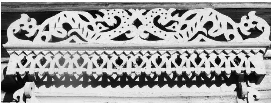
Фрагмент наличника дома Ершовых в Мартыново: навстречу друг другу летят два Ужа-Палучата.

4. Темнякин С.Н. «Уж-Палучато, Змея и Лягушка» // «Кацкая летопись» № 9-10 (92-93), сентябрь-октябрь 1999 года.