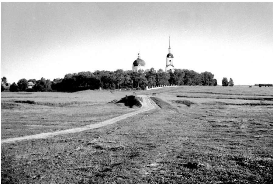
Вид на Николо-Топор от деревни Владыщина.

Снимок Бориса Михайловича Фёдорова (г. Санкт-Петербург), 1950-1951 годы