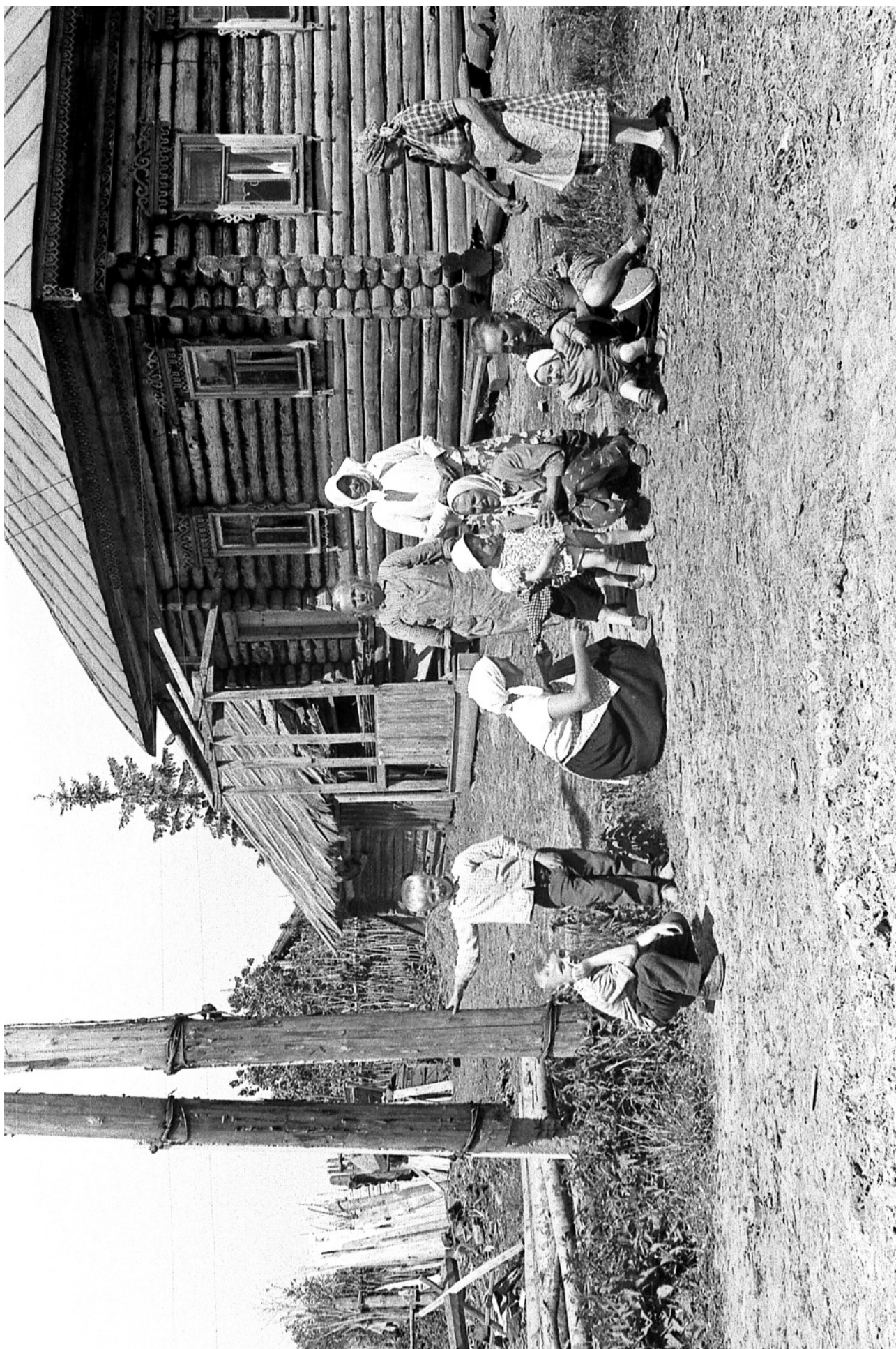
КОМАРОВО. С ДЕТЬМИ. Май-июнь 1965 года.