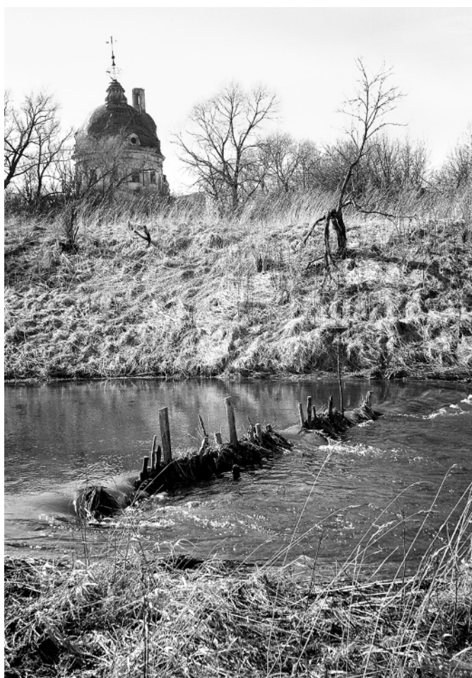
Старый ез на Топорке.

Снимок Ирины Александровны Давыдовой (д. Мартыново), 2011 год