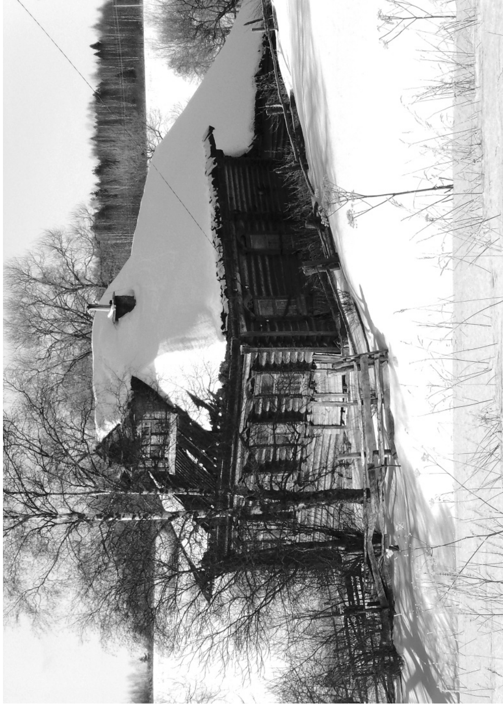
Кадка. Зима. Широбоково.