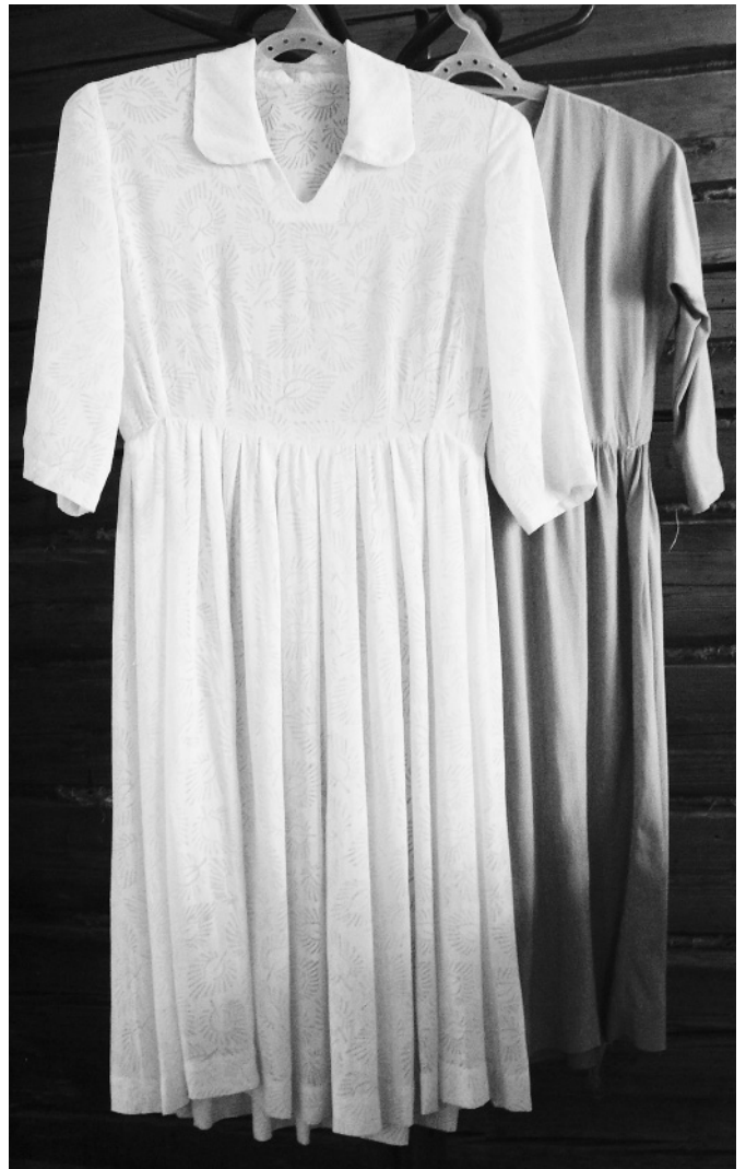
«Платьё сваребное с подстёгою» – платье свадебное на чехле – теперь в собрании Этнографического музея кацкарей.