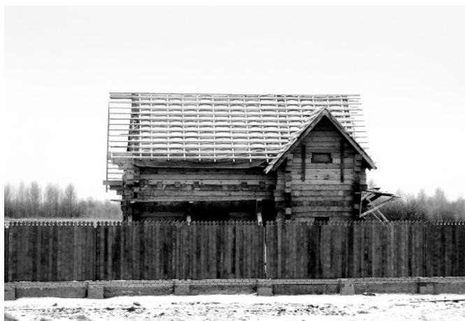
То не дом, то москвичи баню строят. А начали, как у них и полагается, со сплошного красного забора. с Рождествено в Кадке, 2011 год.